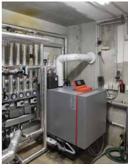
Die neue Anlage mit Pufferspeicher

Ich wollte die Sonnenenergie mitnutzen, also habe ich mich für eine Brennwerttherme mit 500 Liter Pufferspeicher entschieden, an dem eine Solarthermie hängt. Seitdem es von euch diesen Oilfox gibt, kann ich wochengenau übers Handy messen, wie hoch mein Ölverbrauch ist. Seitdem wir die Anlage drin haben, klappt