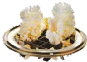
Ohne ClearNOx ®