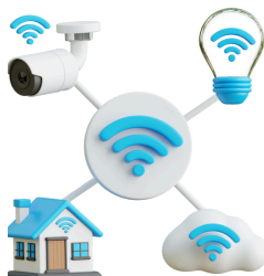
Internet of things verbindet Ihr Zuhause

Immer öfter taucht der Begriff Internet of things (Abk. IoT, dt. Internet der Dinge) auf. Was versteht man darunter?