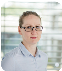
Ihr Marketing-Team der TotalEnergies Wärme&Kraftstoff Deutschland GmbH

Auch im kommenden Jahr sind wir gerne wieder für Sie da – mit aktuellen Informationen, spannenden Neuigkeiten und allem, was für Sie wichtig ist.