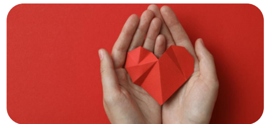
Spendenaktion von TotalEnergies

Denken Sie an unsere Spendenaktion im Dezember und unterstützen Sie gemeinsam mit uns drei gemeinnützige Vereine mit Ihrer Heizölbestellung. Mit jeder Online-Bestellung vom 01. bis 31.12.2025 spenden wir 5€ für Heizöl schwefelarm Bestellungen und 10€ für von Premium-/Bio thermogreen-Heizöl-Bestellungen.