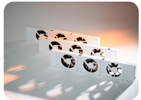
Wohlige Wärme mit den Heizkörperventilatoren von SpeedComfort

„Aufmerksam auf die SpeedComfort-Heizkörperventilatoren wurde ich durch meinen Heizöllieferanten TotalEnergies. Als langjähriger Heizölkunde war ich zunächst skeptisch, ob solche kleinen Lüfter wirklich einen Unterschied machen können. Die Idee hat mich jedoch neugierig gemacht, denn ich möchte es gerade jetzt im Winter gerne warm und gemütlich haben, dabei aber auch meinen Geldbeutel schonen und die gelieferte Wärme effizienter nutzen.