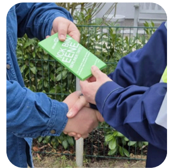
Ein süßer Nikolausgruß

Falls Ihr Tankwagenfahrer Sie mit einer Schokoladentafel überrascht, genießen Sie die Süßigkeit und schenken Sie anderen ein Lächeln.