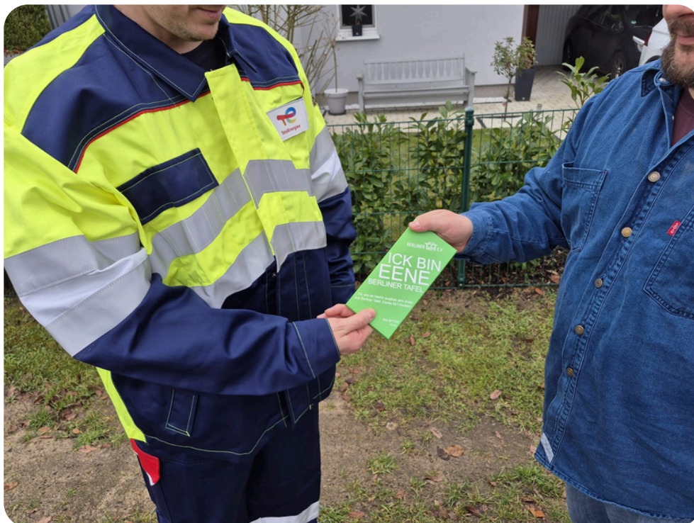
Übergabe einer Schokoladentafel an einen treuen Heizölkunden