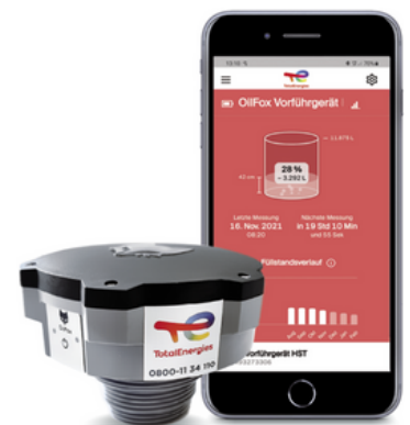
OilFox-Sonde und App

Für jeden Tank die passende Sonde: verschiedene Sonden für Ihren individuellen Tank